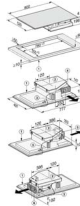
KMDA 7633 FL, KMDA 7634 FL - rahmenlos aufliegend (Skizze)