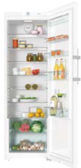
KWT 28202 ws