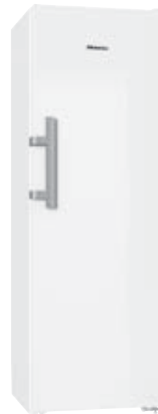
K 28202 edt/cs